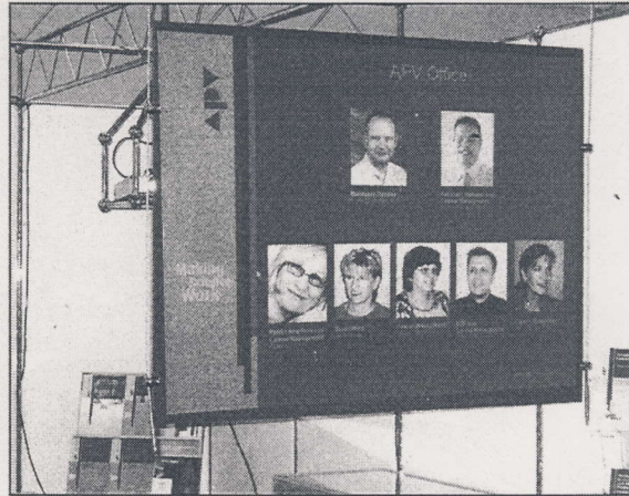
Am Stand der APV auf der diesjährigen Technopharm in Nürnberg konnten die Besucher und Aussteller eine neuartige Rückprojektionsscheibe bewundern.

Alle diese Sonderanwendungen sind heute dadurch möglich, dass die verschiedenen international tätigen Beamerhersteller eine Vielfalt von Geräten und Variationen anbieten. Dies gilt sowohl hinsichtlich der Leistungsstärke der Beamergeräte als auch der vielfältigen Nutzungsmöglichkeit hinsichtlich Projektionsbreite und -tiefe oder dem Abstand zur Projektionsfläche. Spezielle Beamer mit einer eingebauten Lichtführung über Spiegelumlenkung ermöglichen die Projektion auf Projektionsflächen aus einer Distanz von nur 30-40 cm Abstand. Fast selbstverständlich ist hierbei, dass es mittlerweile auch eine breite Vielfalt an Möglichkeiten gibt, wie die Beamer der jeweiligen Situation angepasst ver-